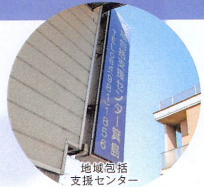
地域包括 支援センター